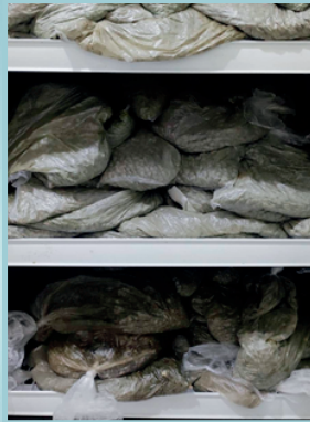
Metarhizium in packs