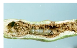
Bean pod borer