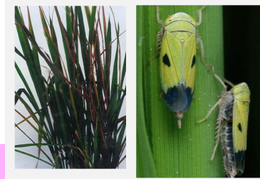
Berdeng ngusong kabayo