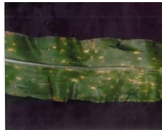
Southern Leaf Spot