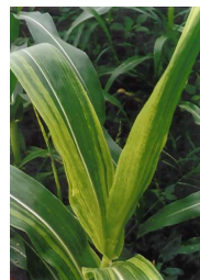
Mosaic maize stripe