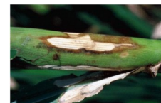
Banded Sheath & Leaf Blight