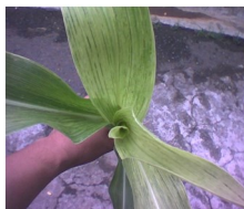
Maize Dwarf Mosaic