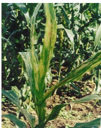
Bacterial Leaf Blight