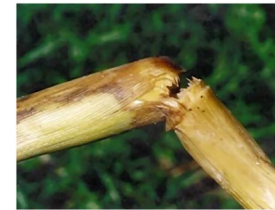
Bacterial Stalk Rot