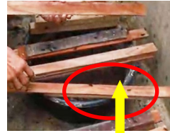
Planggana may attractant