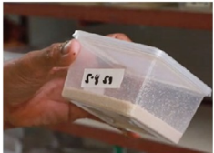
Microwavable container na may itlog