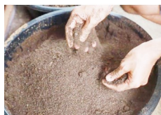
Frass o dumi ng larva