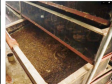
Halimbawa ng bin na lagayan ng larva