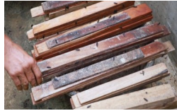
Eggies o paitlugan