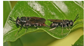
Pagtatalik ng BSF