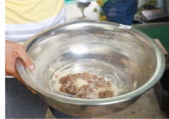
Plangganaang may napsang itlog ng BSF