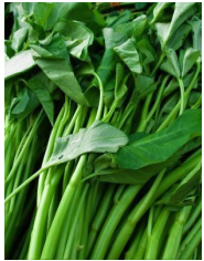
1 kg. kangkong