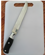
Kutsilyo at tadtaran