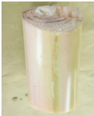
1 kg. puno ng saging