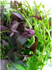
1 kg. talbos ng kamote