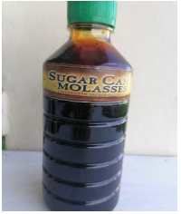
3 kg. molasses