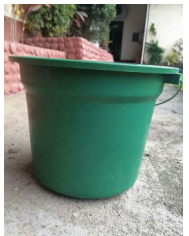
Malinis na timba