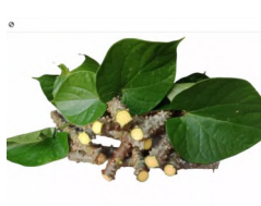
100 gramo ng makabuhay