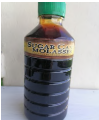
200 gramo ng muscovado o molasses