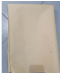
Manila paper o katsa