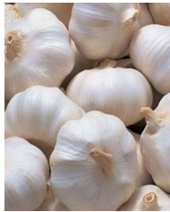
1 kilo ng bawang