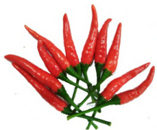
200 gramo ng sili