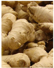
1 kilo ng luya