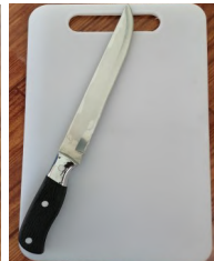
Kutsilyo at tadtaran