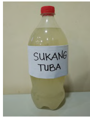
2.2 litro ng sukang tuba