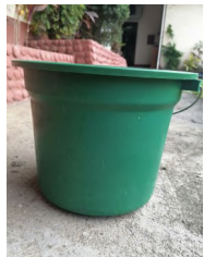
Malinis na timba o container