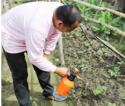
Pag-eesprey ng organikong pataba

Upang maiwasan ang paninira ng mga peste at sakit sa halaman, mainam na panatilihin ang mga kultural na pamamaraan at panatilihin ang kalinisan sa paligid ng taniman. Ang karaniwang insekto ng upo ay ang yellow beetle at karaniwang sakit naman ay ang fruit rot .