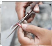
Paggupit sa buto ng upo