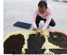
Paghahalo-halo ng compost , organikong pataba, lupa at inuling na ipa