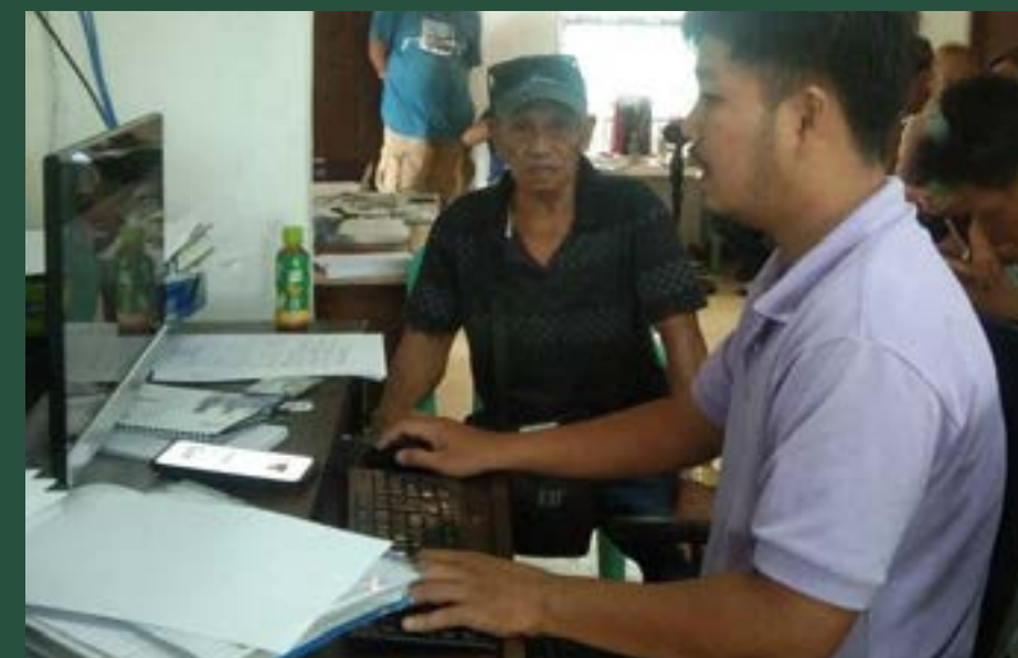
An LGU staff interviews a farmer using the RCM application.

Labing-dalawang (20) mga magsasaka ng palay mula sa limang barangay ng Pamplona ang naging bahagi nito at nabigyang ng isang pahinang rekomendasyon na nagsasaad ng tamang fertilizer, tamang dami at tamang panahon ng paglalagay nito. Meron din mga rekomendasyon tungkol sa tamang panahon ng paglalagay ng insecticide, pagdadamu at alternate wetting and drying o AWD.