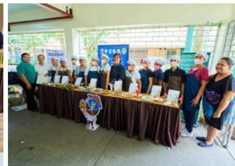
Ipinagmalaki ng mga contestant ang kanilang mga luto sa OA Master Chef Cook-Off

PILI, Camarines Sur – Naging makulay at masaya ang ginanap na isang araw na culmination activity ng 9th Organic Agriculture Month Celebration na may temang 'Kabuhayang OA, Kinabukasang OK!'