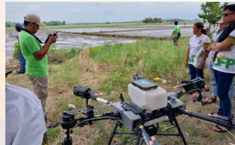
New Hope Precision Agriculture Corporation staff prepares drone before the actual seed broadcasting.

Let's Fly! Let's go Digital! PRIMALOU B. IMPERIAL