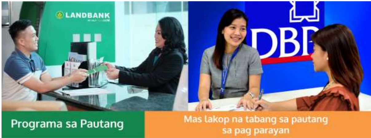
Programa sa Pautang