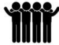
Binibisto o Akreditado san DA na mga Kooperatiba o Asosasyon nin Mga Para-Uma