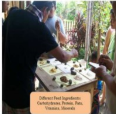
Different Feed Ingredients: Carbohydrates, Protein, Fats, Vitamins, Minerals

Lain-laing "energy feed", protina ug uban pa dunay lahi-lahing sangkap nga nutrisina kada kilo. Ang matag nutrisina kasagarang makomparar base sa presyo sa matag kilo sa maong nutrisina.