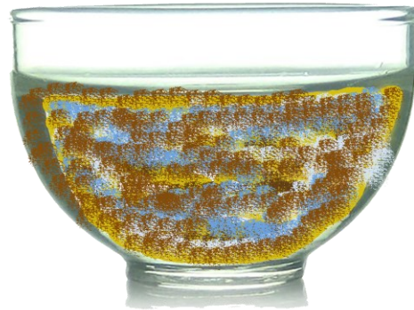
Naglaok nga OHN ken IMO wenno FPJ

b. Mabalín met nga ilaok daytoy iti naisa-gana a IMO wenno FPJ concoction.